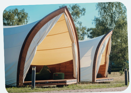
ab Juli auf Kaltehofe

Buchen Sie ein Eventzelt zu Ihrer Veranstaltung dazu und genießen Sie das wettergeschützte Ambiente, z.B. in der Lounge >Bille<